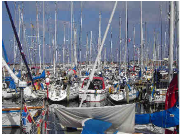
Der var ikke meget plads at give væk af i Læsø Havn.