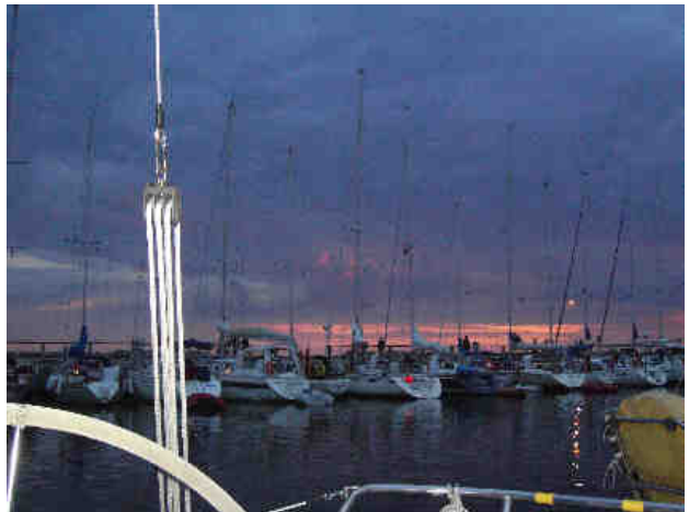
Aftenhimmel på Anholt.