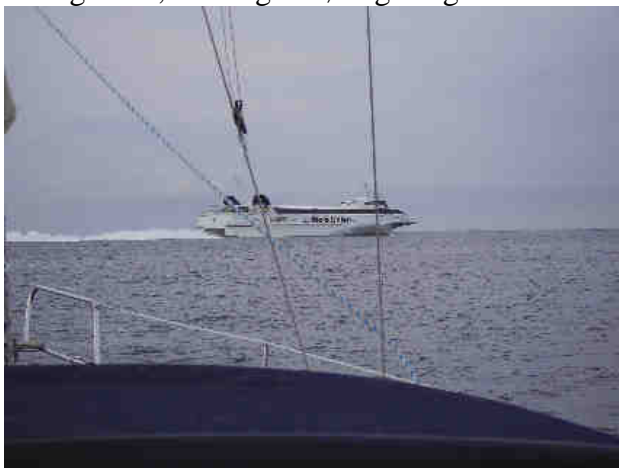
Den ene af hurtigfærgerne.