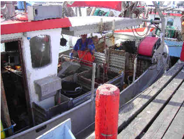
Freddys nye bekendtskab og leverandør af de dejlige krabbekløer.