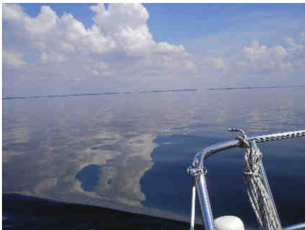
Havblik. Skyerne spejler sig i glasklart vand.