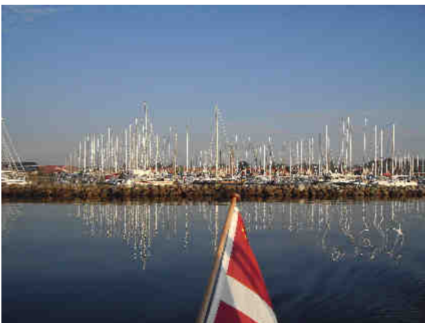
Tidlig morgen i sol og havblik i Kerteminde.

Så var det sidste etape hjemad, som blev tiltrådt 6.45 i absolut havblik, som holdt sig til vi var stort set hjemme. Det blev altså en sejlads for motor på et vand, der var blankt som glas. Vi så igen en skypumpe, der prøvede at nå jorden, men måtte opgive på halvvejen.