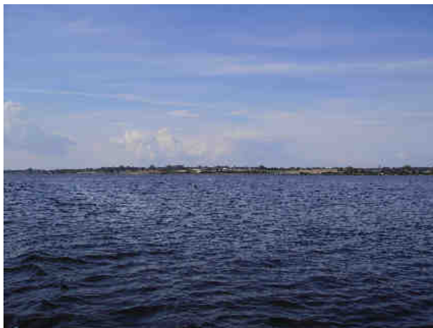
I Grønsund ud for Bogø.

Så er ringen sluttet og sommerens togt slut. Det har været en pragtfuld ferie. Vi må tilbage til skærgården til næste år.