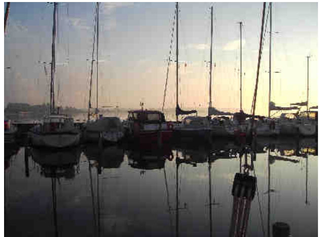
Havnen i Kerteminde.