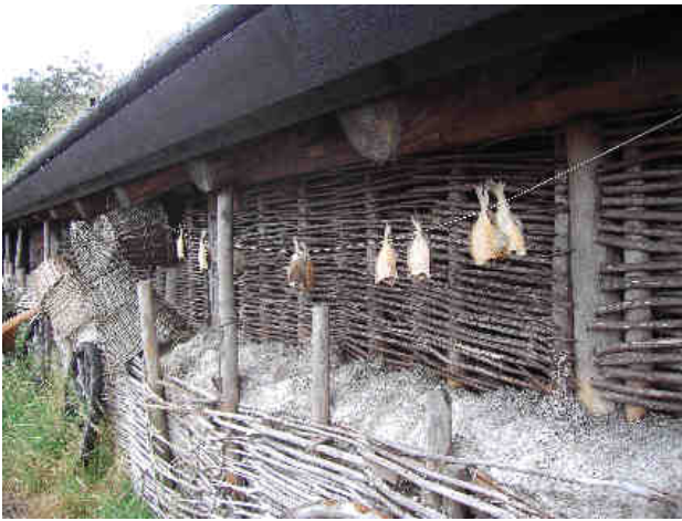
Fisk til tørre på Læsø Saltsyderi.